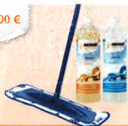
Erstpflege Reinigungspaket Wischer mit Tuch, Care 1L & Neutralreiniger 1L