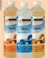
Pflegeset versiegelte Böden Care 2L & Neutralreiniger 1L

Eine große Auswahl an Bembé Zubehör, Pflege- und Reinigungsprodukten erhalten Sie in unseren 50 Studios oder im OnlineShop unter shop.bembe.de