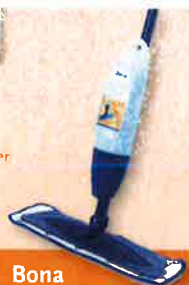
Bona Spray Mop Set