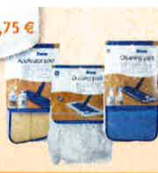
verschiedene BONA Reinigungs- & Wischtücher