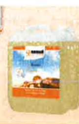
Bembé Care 5L für versiegelte Böden