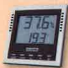
Venta Digital Thermo-Hygrometer