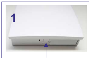
1 Entriegelung des Gehäusedeckels drücken; Frontdeckel abnehmen