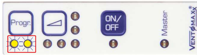
Filter-Wechsel Anzeige durch Blinken der LED