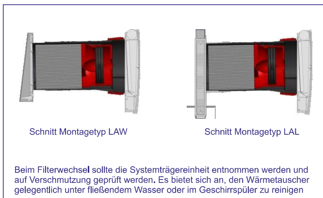
Schnitt Montagetypp LAW