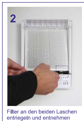
2 Filter an den beiden Laschen entriegeln und entnehmen