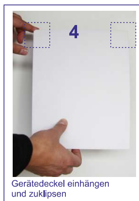
4 Gerätedeckel einhängen und zuklipsen