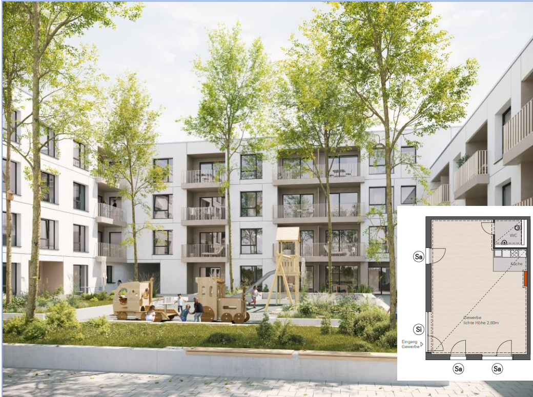
Ansicht Innenhof, Gewerbe liegt zur Straße. Rendering aus Sicht des Illustrators.

Charmante Geschäftsfläche in Nürnberg/Tafelgelände, Fritz-Pirkl-Straße 3, 1-Raum-Gewerbe