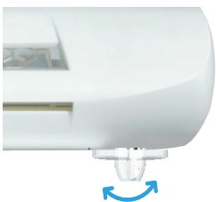
ZFHV 5-35 / ZFHVA 5-35

Reinigen Sie die Oberfläche mit einem normalen Staubtuch.